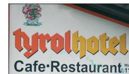
Eine besonders merkwürdige Anwendung der »Grotesk-Gotisch«, wahrscheinlich eine modifizierte Deutschland, gerade in Tirol! Das »y« bzw. die »Ligatur« »ty« scheint nachträglich gestaltet worden zu sein.