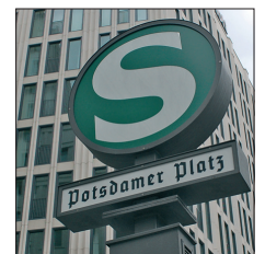
Ein sehr prominentes Beispiel der Tannenberg: die S-Bahn-Station am Potsdamer Platz in Berlin.

Was vor gut fünfundsiebzig Jahren als »neue deutsche Schrift« in die Welt gesetzt wurde, bleibt bis heute ein faszinierendes Kapitel der Schriftgeschichte. Im Oktober 1933 taucht erstmals eine Anzeige für die Tannenberg 1 auf – die erste »Grotesk-Gotisch« 2 , landläufig »Schaftstiefelgrotesk« genannt. Im Dezember gesellten sich ihr die Element 3 und die National 4 hinzu. Als vierte ist die Deutschland 5 zu nennen, wobei sie nicht in dem Maße »vergrößert« wurde. 1935 erschien schließlich noch die Potsdam 6 , aber etwas »defensiver« abstrahiert und beworben. Die Tannenberg und die National sind sich in ihrer Gestaltung ähnlich, von beiden wurden auch schmal laufende Varianten entwickelt, sozusagen »Grotesk-Gotisch Condensed«-Schnitte (sowie Zierbuchstaben). Diese Verdichtung kommt ihnen ästhetisch durchaus entgegen und verstärkt ihren Charakter, weshalb sie auf vielen Anwendungen so zu sehen sind.