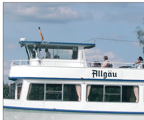
Es ist kein neuer »KdF«-Dampfer, sondern ein Ausflugsschiff der Forggensee-Schiffahrt in Füssen. Die Namen ihrer Flotte sind in der Tannenberg 11 gesetzt.