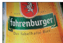
Großflächenplakat der Brauerei »Fohrenburger« – Gastronomie und Biermarken sind seit langem eine letzte Bastion der gebrochenen Schriften; hier eine modifizierte (vor allem bei den Untertönen am »h« und »f«) Tannenberg.