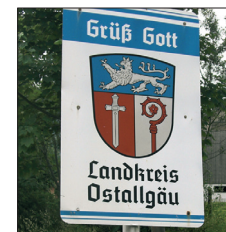
Auch der Landkreis begrüßt seine Gäste und Durchfahrende – sicher in bester Absicht – mit der Tannenberg.