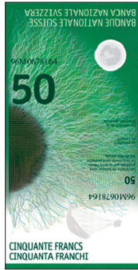
Design: Andrés Netthoevel, Biel